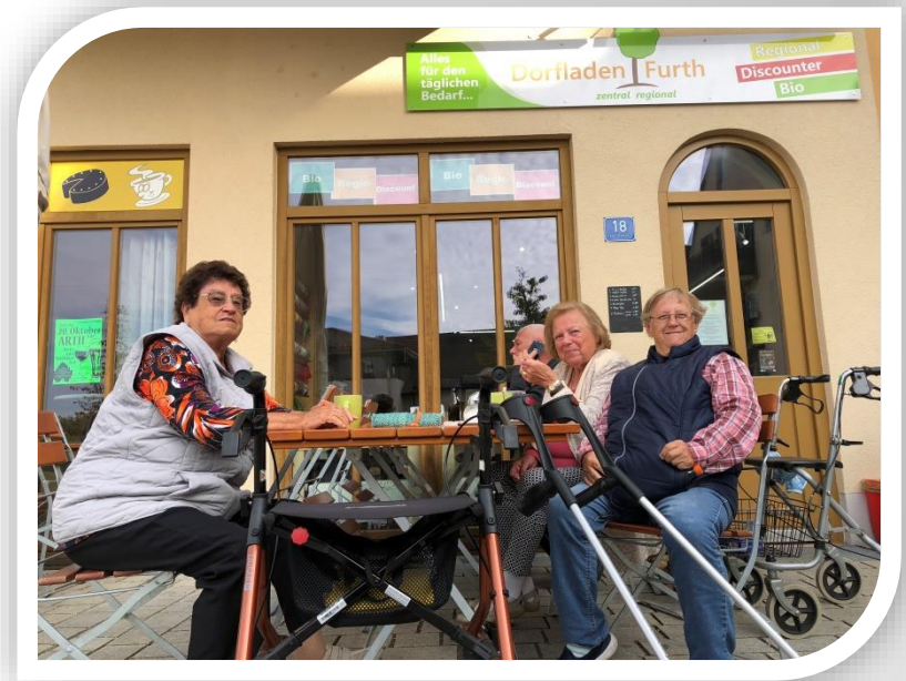
Der Dorfplatz als zweites Wohnzimmer