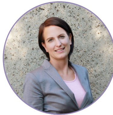
Vanessa Eck/ Grafik