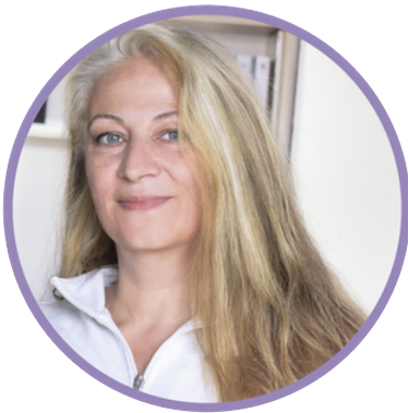
Christa Polch/ Grafik